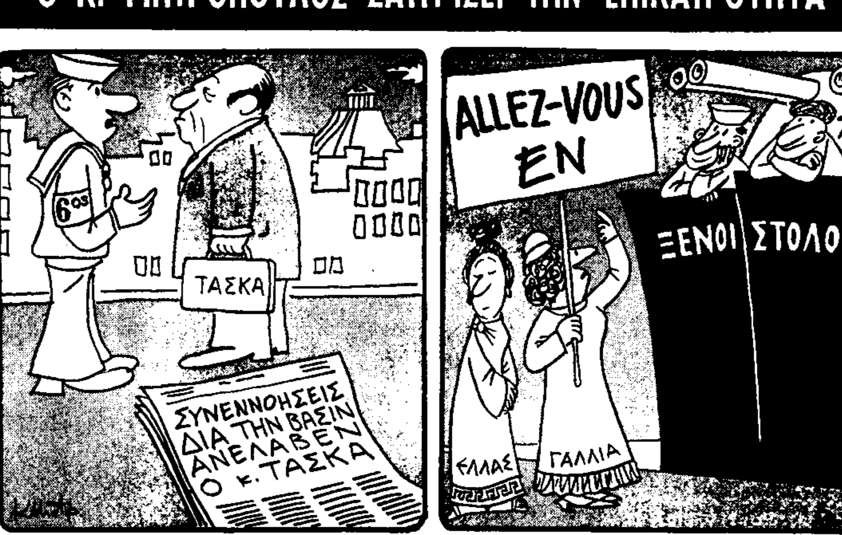
Νέανι ανατολικοεσθμική, με θεία πρὸς τὴν 'Ακρόπολη, εὐσεβή, εὐλαβία...